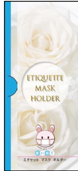
Etiquette Mask Holder タイプC