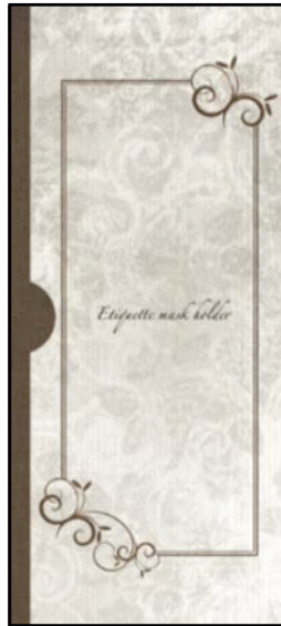
Etiquette Mask Holder タイプB