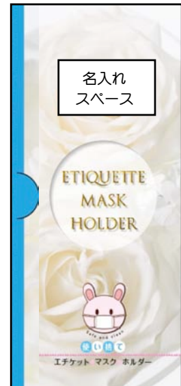
Etiquette Mask Holder タイプC