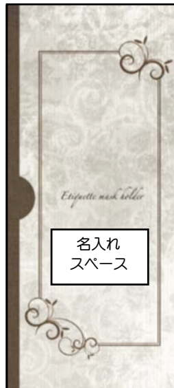
Etiquette Mask Holder タイプB